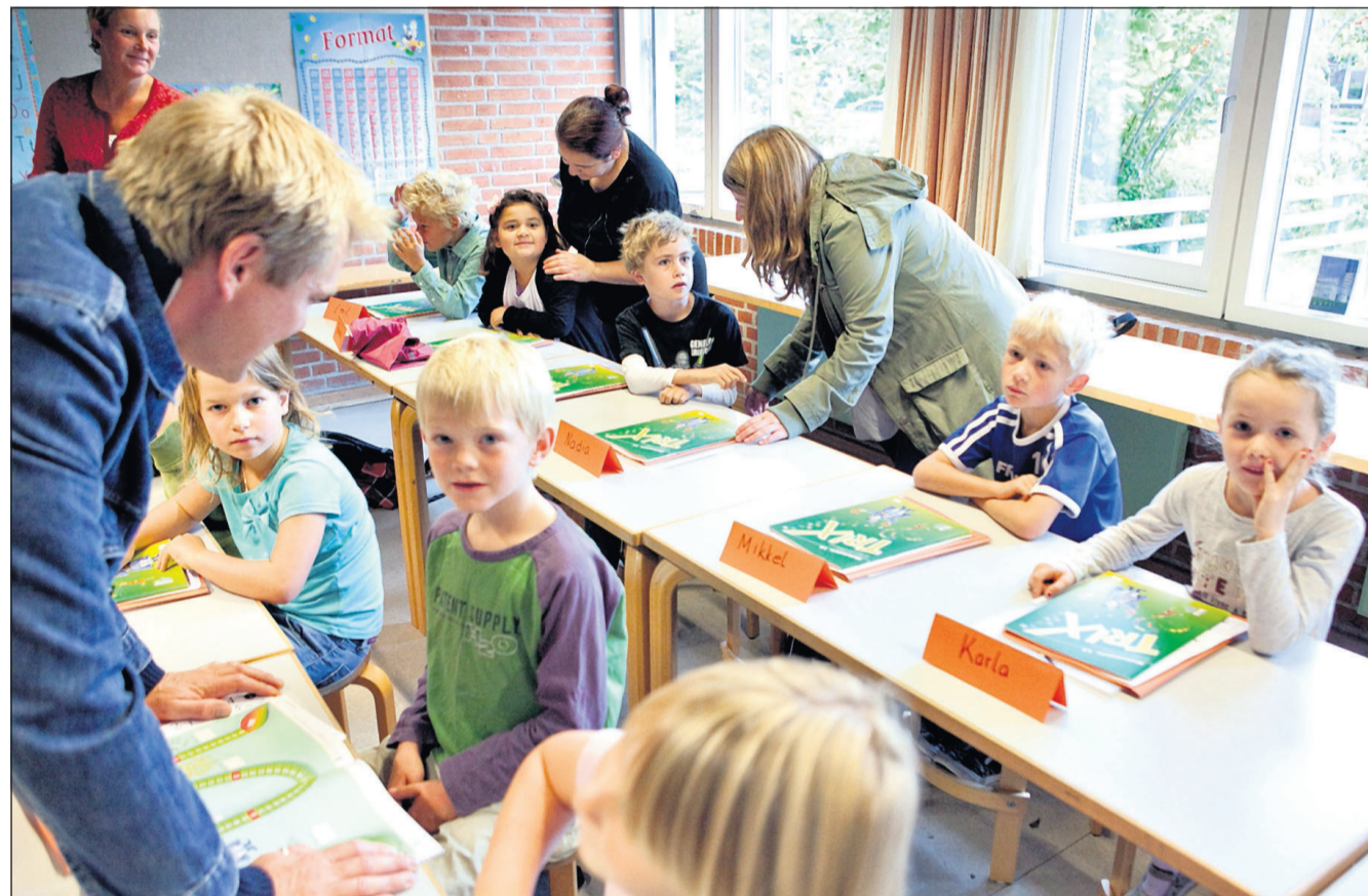
Helsingørs folkeskoler får et stort løft som følge af pengegaven fra A.P. Møller Fonden.