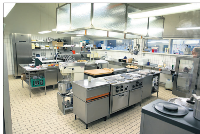
Køkkenet på Rasmus Knudsens Vej står foran en større ombygning, som skal skabe plads til undervisning af 20 elever.

- Et led i skolens genopretningsplan fra 2012 var blandt andet, at vi ønskede at etab-